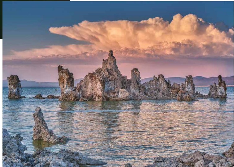
Foto: Helmut Pokluda „Monolake“, Fotogruppe Favoriten, Sparte Landschaft